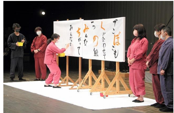
■筆文字『筆文字くらぶ』