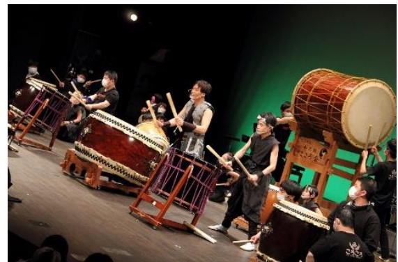
■和太鼓『どんど鼓』(知的障がい)