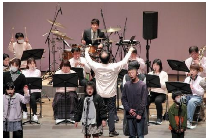
令和4年度 会場のようす