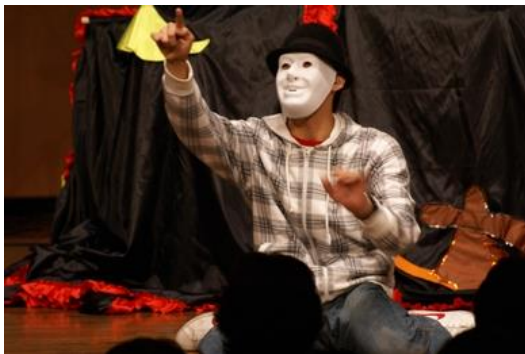
■大道芸人きぼう (聴覚障がい)