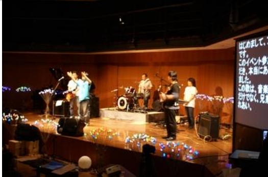
■手話ロックバンド『ブライトアイズ』(聴覚障がい)