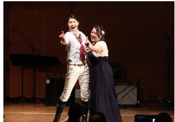
■手話ソング『dream★姫』(聴覚障がい)