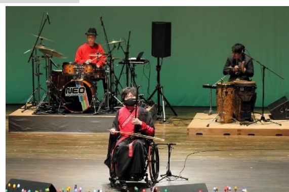
■音のセッション『出口くん&煉』