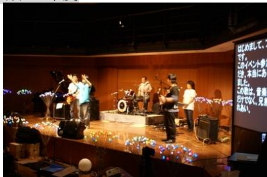
■手話ロックバンド『ブライトアイズ』(聴覚障がい)