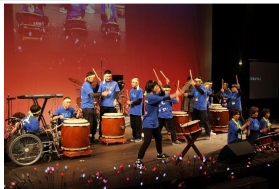
■和太鼓『どんど鼓』(知的障がい)