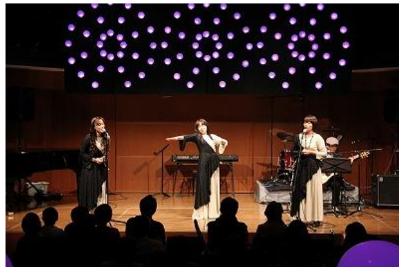
■手話ソング『ウィッシュブレス』(聴覚障がい)