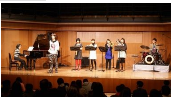
■障がいのある方とミュージシャンの共演