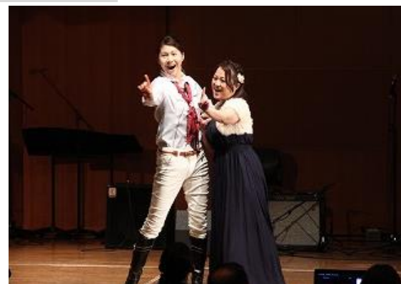
■手話ソング『dream★姫』(聴覚障がい)